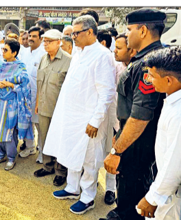
फतेहाबाद। अनाज मंडी में फसल खरीद कार्य का निरीक्षण करती तथा निगरानी समिति की बैठक में जन शिकायत सुनती सांसद कुमारी सैलजा।

फतेहाबाद पहुंची सांसद सैलजा, अनाज मंडी में खरीद कार्यों का किया निरीक्षण चिल्ली के सौंदर्यीकरण पर करोड़ों खर्च पर सांसद नाराज डीसी से पूछा : 13 करोड़ कहां हुए खर्च, जांच करवाओ