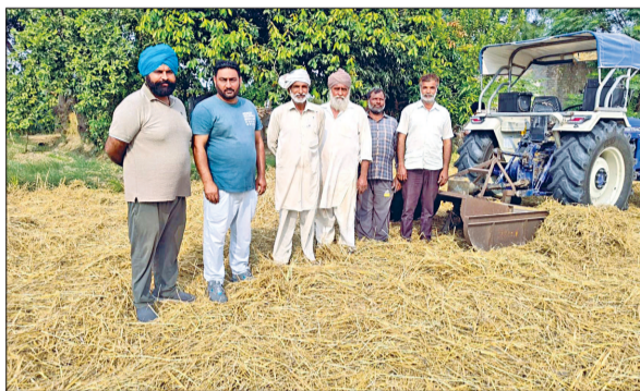
टोहाना। पराली प्रबंधन को लेकर रोष जताते किसान।

जिले के खेतों में धान की कटाई का कार्य जोरों से चल रहा है। कई किसानों द्वारा धान कटाई कर ली गई है, लेकिन पराली प्रबंधन के लिए आवश्यक मशीनें उपलब्ध न होने से किसानों को परेशानी का सामना करना पड़ रहा है। किसानों का कहना है कि पराली जलाने से होने वाले प्रदूषण को रोकने के लिए एक तरफ जहां सरकार ने पराली जलाने पर रोक लगा दी है वहीं खेतों में धान अवशेषों का निष्पादन मशीनों के जरिए करना अनिवार्य किया गया है। धान अवशेषों को आग लगाने पर सरकार द्वारा जुर्माना और कठोर कानूनी कार्रवाई का नियम बनाया गया है। इससे किसान परेशान हैं। उनका कहना है कि खेतों में फसल अवशेष जलाने पर सरकार किसानों पर जुर्माना लगाने पर आमादा है, जबकि सरकार उन्हें पराली खत्म करने के लिए मशीनें उपलब्ध ही नहीं करा रही है।