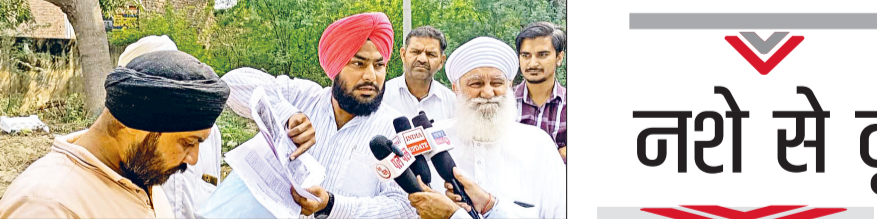
सिरसा। शिरोमणि भगत नामदेव जी का 755वां प्रकाशोत्सव