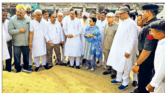
फतेहाबाद। अनाज मंडी में फसल खरीद कार्य का निरीक्षण करती तथा निगरानी समिति की बैठक में जन शिकायत सुनती सांसद कुमारी सैलजा।

सिरसा लोकसभा क्षेत्र की सांसद एवं अखिल भारतीय कांग्रेस कमेटी के राष्ट्रीय महासचिव कुमारी सैलजा मंगलवार को फतेहाबाद दौरे पर रही। उन्होंने पहले अनाज मंडी स्थित जिला कांग्रेस कार्यालय में कार्यकर्ताओं से मुलाकात की और उसके बाद अनाज मण्डी में धान खरीद कार्य का निरीक्षण किया। उन्होंने आदितियों, मजदूरों, ठेकेदारों की समस्याएं सुनी और उन्होंने संबंधित अधिकारियों को निर्देश दिए कि मंडी में फसल खरीद, उठान, लदान के कार्यों में कोताही नहीं बरती जाए। इसके बाद सांसद सैलजा डीपीआरसी हॉल में जिला विकास समन्वय एवं निगरानी समिति की मीटिंग में पहुंचीं। मीटिंग की अध्यक्षता करते हुए सांसद कुमारी सैलजा ने अधिकारियों की जमकर क्लास लगाई। चिल्ली झील के सौंदर्यीकरण के नाम पर करोड़ों रुपये खर्च होने पर सांसद ने डीसी को पेपर दिखाते हुए कहा कि यहां