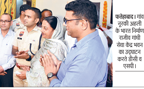
फतेहाबाद। गांव नुरकी अहली के भारत निर्माण राजीव गांधी सेवा केंद्र भवन का उद्घाटन करते डीसी व एसपी।