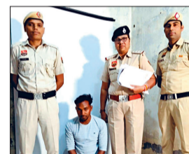
धमकी देकर ब्लैकमेल कर रहा था। पीड़िता ने उसका विरोध किया तो आरोपी ने उसकी अश्लील वीडियो वायरल कर दी। महिला की शिकायत के आधार पर महिला थाना सिरसा में 26 अक्टूबर को अभियोग दर्ज कर जांच शुरू की गई थी।