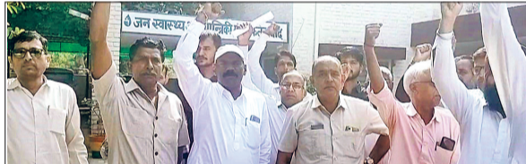
फतेहाबाद। कार्यकारी अभियंता के खिलाफ रोष जताते कर्मचारी।

जनस्वास्थ्य विभाग के कार्यकारी अभियंता की हठधर्मिता और अडिगल रवैये से खफा कर्मचारियों ने आंदोलन का बिगुल बजा दिया है। जनस्वास्थ्य विभाग की तीनों संगठनों द्वारा बनाई गई ज्वाइंट एक्शन कमेटी के बैनर तले कर्मचारियों द्वारा 29 अक्टूबर को कार्यकारी अभियंता के खिलाफ मंडल कार्यालय पर धरना प्रदर्शन किया जाएगा। ज्वाइंट एक्शन कमेटी ने चेतावनी दी है कि यदि इसके बाद भी अधिकारी का रवैया नहीं