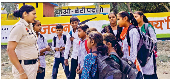
फतेहाबाद। शिक्षण संस्थानों के बाहर छात्राओं को जागरूक करती महिला पुलिस टीम।