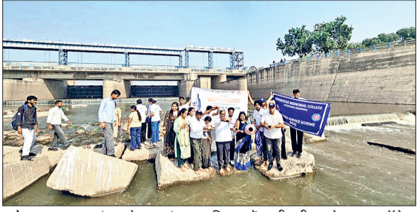
फतेहाबाद। ‘जल संगम से जन संगम’ अभियान में भागीदारी करते एमएम कॉलेज के वॉलंटियर्स।