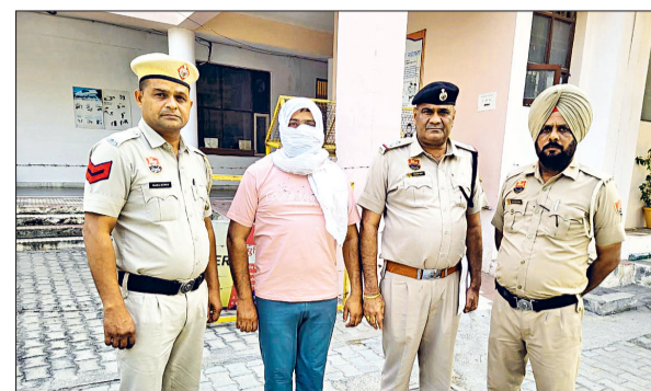
फतेहाबाद। पुलिस गिरफ्त में प्रोपर्टी हड़पने का आरोपी।

पत्रकारों से बातचीत करते हुए सांसद कुमारी सैलजा ने कहा कि प्रदेश की भाजपा सरकार पूरी से फेल साबित हुई है। सरकार ने आंच और कान बंद कर रखे हैं वह न कुछ देख रही है और न ही कुछ सुन रही है। जनता अपने हकों के लिए चीख पुकार मचा रही है। कर्मचारी मांगों को लेकर सड़कों पर हैं। अनाजमंडी में किसान फिर पकड़कर बैठा हुआ है। धान और बाजरे का कोई रेट नहीं है, मूंगफली उत्पादक किसान भटक रहा है। मंडी में सबसे ज्यादा परेशान मजबूर हैं क्योंकि धान सीधा राइस मिल में जा रहा है। उन्होंने कहा कि जहां पर जलभराव हुआ था वहां से अभी तक जल निकासी नहीं हुई है जिस कारण बीमारियां फैल रही हैं। सांसद ने कहा कि नशा रोकने में सरकार नाकाम रही है, सिरसा और फतेहाबाद जिला नशे से ज्यादा प्रभावित है, युवाओं की मौत हो रही है। उन्होंने कहा कि अगर सरकार ने रोजगार दिया होता तो युवा नशे की ओर कदम न बढ़ाता। सरकार को इस दिशा में सख्त कदम उठाना चाहिए।