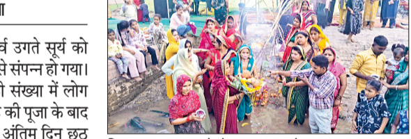
सिरसा। छठ पूजा को लेकर पूजा करते हुए श्रद्धालु

चार दिनों तक चलने वाले छठ महापर्व उगते सूर्य को अर्घ्य देने के बाद मंगलवार को धूमधाम से संपन्न हो गया। दिल्ली पुल पर बने घाटों पर हजारों की संख्या में लोग उमड़े और छठ मईयां की पूजा की। सुबह की पूजा के बाद सुहागिनों ने अपना व्रत खोला। छठ के अंतिम दिन छठ मैया की महाआरती की गई। छठ व्रतियों ने दिल्ली पुल पर बने घाटों पर उगते सूर्य की उपासना की। इसके साथ ही 36 घंटे का निर्जला उपवास भी खत्म हुआ। यह महापर्व बीती 25 अक्टूबर को नहाय खाय से शुरू हुआ था जो मंगलवार को उगते सूरज को ऊषा अर्घ्य के साथ समाप्त हो गया। इसके साथ ही 36 घंटे का निर्जला उपवास भी खत्म हो गया। छठ व्रतियों ने अमृत योग में सोना, चांदी, पीतल, एवं बांस के छाजों, जों, ढेकूआ,